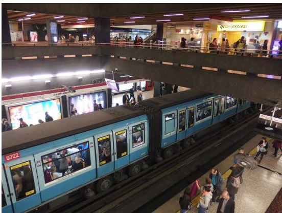
Imagen 4. El AMS se materializa en un mosaico de 34 comunas a partir de una definición claramente estadística. Servicios como el Metro de Santiago, sirven solo a una porción de su población.