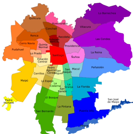
Imagen 2. Comunas de Área Metropolitana de Santiago (2017)